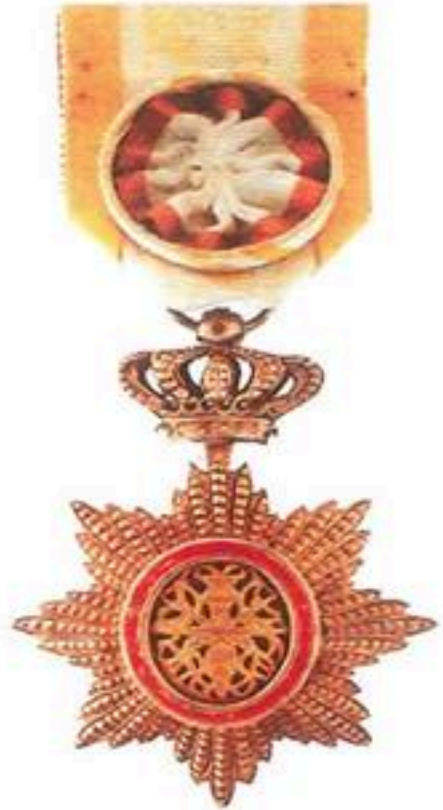
មេដាយព្រះរាជាណាចក្រកម្ពុជា ថ្នាក់ សេនា ផលិតនៅប្រទេសកម្ពុជា