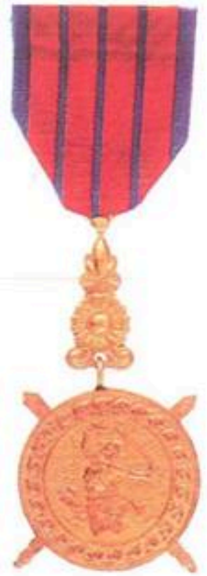
មេដាយការពារជាតិ សម័យសាធារណរដ្ឋខ្មែរ ផលិតនៅសហរដ្ឋអាមេរិក (១៩៧០_១៩៧៥)