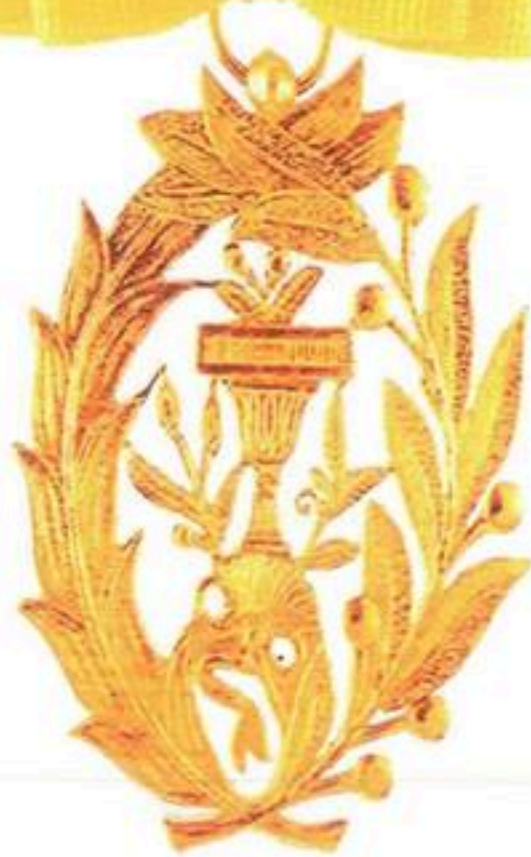
មេដាយមុនីសារាភ័ណ្ណ ថ្នាក់ បដិបត្តិ Royal Order Of Monisaraphon, Commander