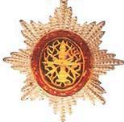
មេដាយព្រះរាជាណាចក្រកម្ពុជាថ្នាក់ អស្សបូជី ផលិតនៅប្រទេសកម្ពុជា