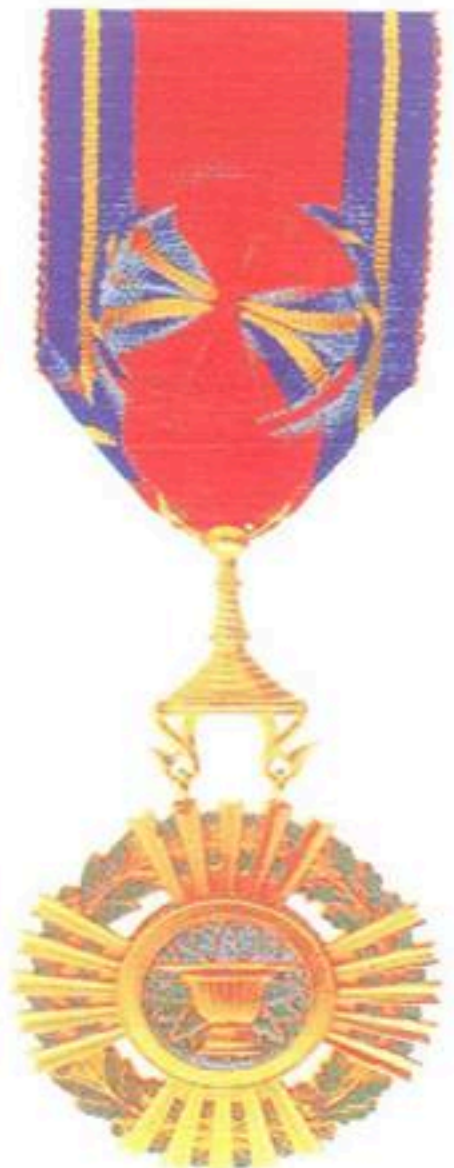
មេដាយសហមេត្រី ប្រើប្រាស់មុនឆ្នាំ ១៩៧០ ផលិតនៅប្រទេសចារ៉ាំង