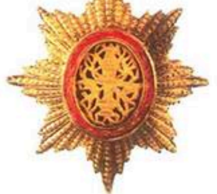
មេដាយព្រះរាជាណាចក្រ កម្ពុជាថ្នាក់ សេនា ផលិតនៅប្រទេសកម្ពុជា