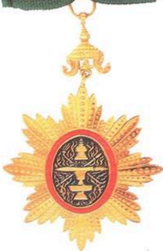
មេដាយព្រះរាជាណាចក្រកម្ពុជា ថ្នាក់និបទិដ្ឋ Royal Order Of Cambodia Commander