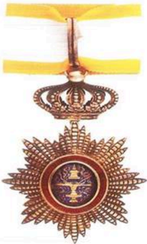
មេដាយព្រះរាជាណាចក្រកម្ពុជាថ្នាក់ ធិបតី ផលិតនៅប្រទេសចារ៉ាង