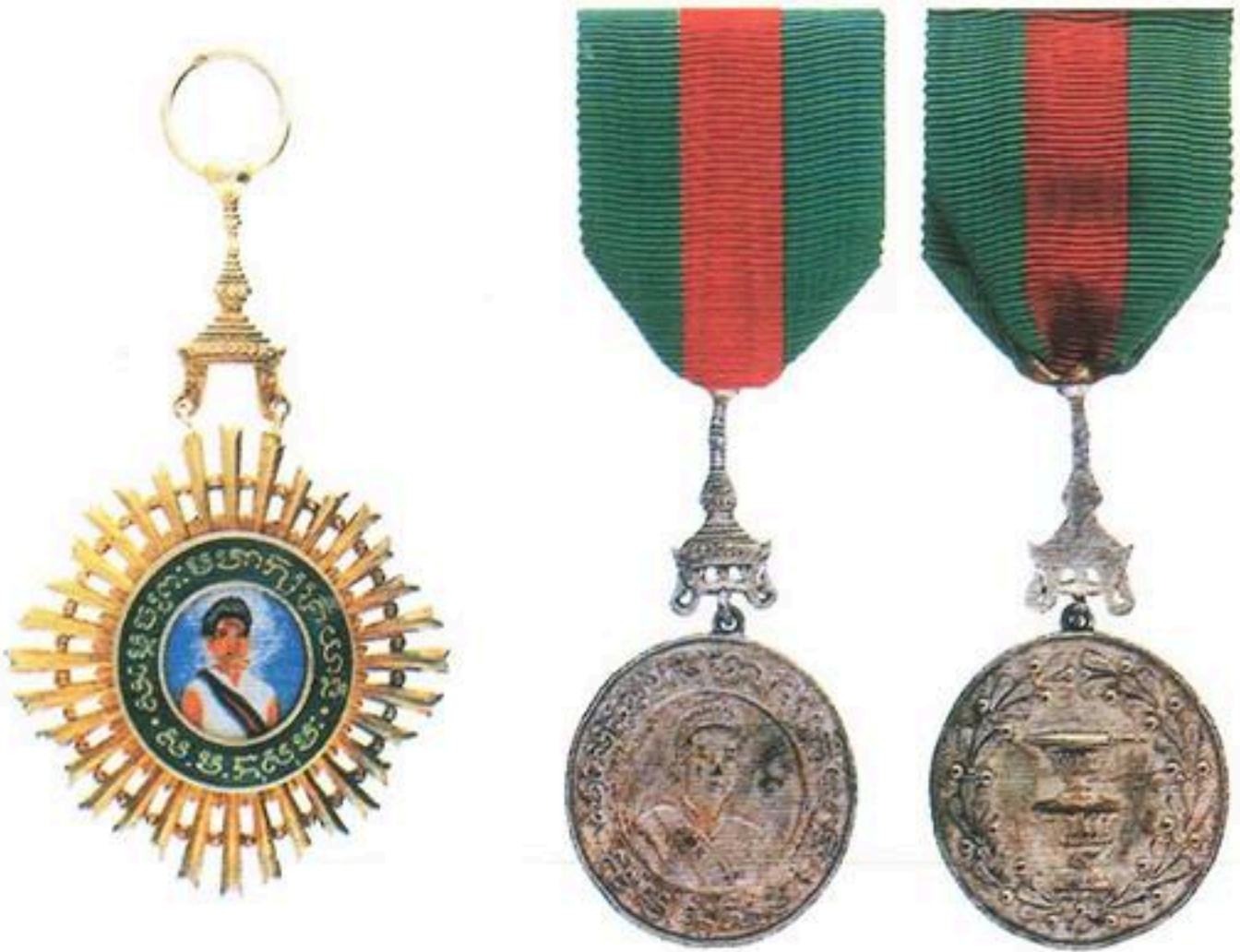
មេដាយសម្តេចព្រះមហាក្សត្រីយានី ស.ម កុសុមៈ ប្រើមុនឆ្នាំ ១៩៧០