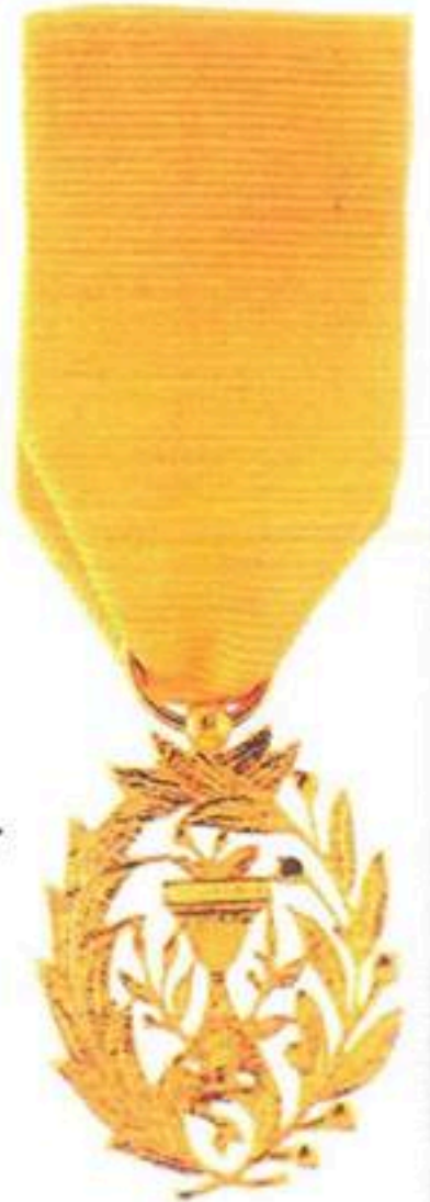
មេដាយមុនីសារាភ័ណ្ណ ថ្នាក់ អស្ស័យទ្ធិ Royal Order Of Monisaraphon Chevalier