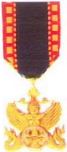
មេដាយសេនា ជ័យសិទ្ធសាធារណរដ្ឋខ្មែរ ១៩៧០--១៩៧៥)

Sena Jayaseddh Medal (Khmer Republic 1970-1975)