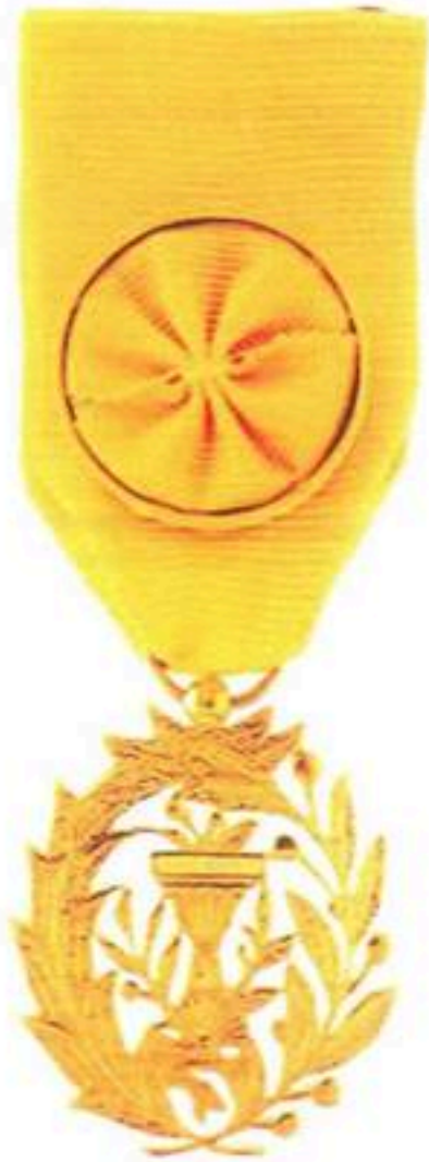
មេដាយមុនីសារាភ័ណ្ណ ថ្នាក់ សេនា Royal Order Of Monisaraphon Officer