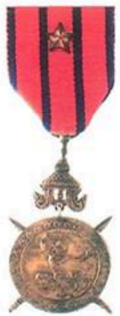
មេដាយមាសការពារជាតិ National Defense Medal Gold