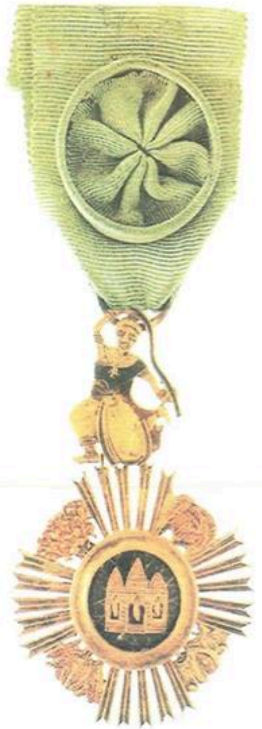
មេដាយសុវត្ថាភា ប្រើប្រាស់មុនឆ្នាំ ១៩៧០