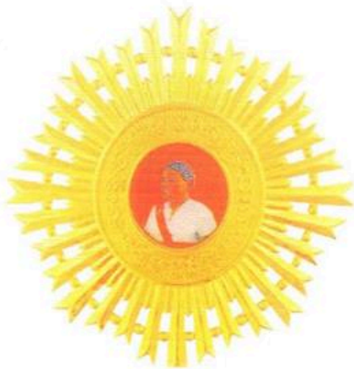
មេដាយសម្តេចព្រះមហាក្សត្រីយានី ស.ម.កុសុមៈផ្កាកំ មហាសេរីវឌ្ឍន៍ Order Of H.M The Queen Preah Kossomak Nearireath Grand Cross