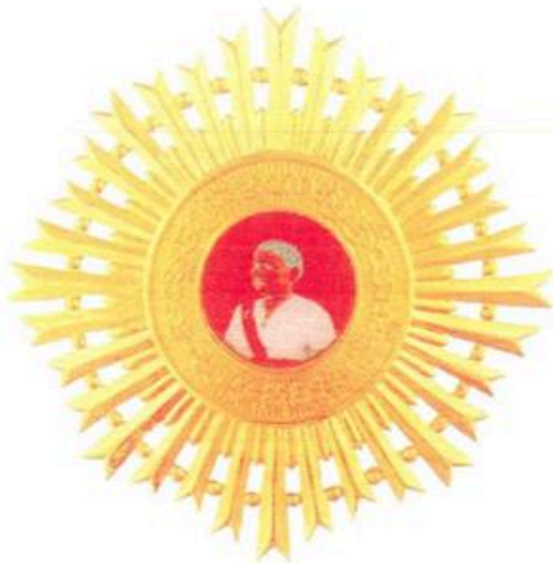
មេដាយសម្តេចព្រះមហាក្សត្រីយានី ស.ម.កុសុមៈផ្នាក់ មហាសេនា Order Of H.M The Queen Preah Kossomak Nearireath Grand Officer