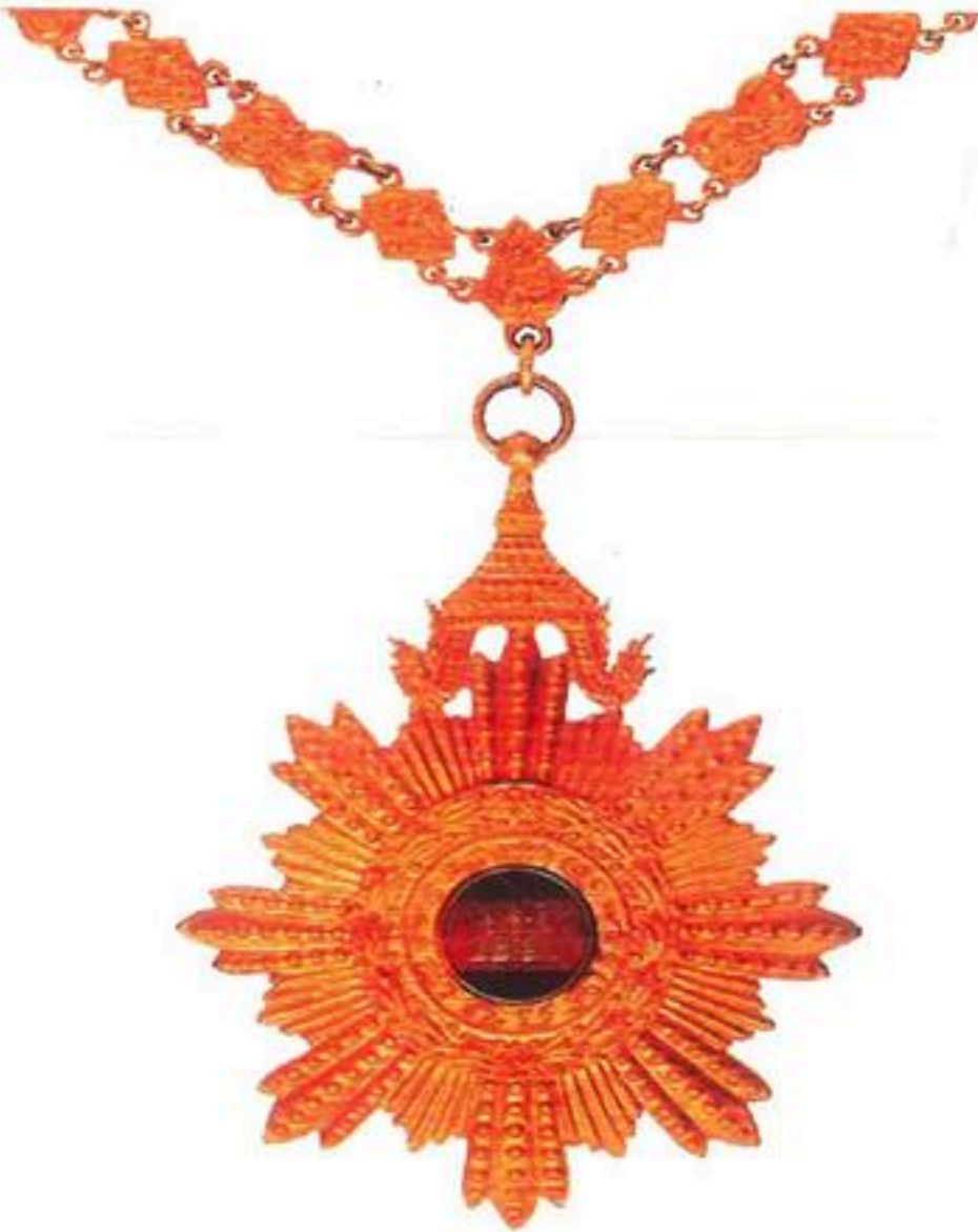
មេដាយ ជាតិបូជាការ Medal Of National Merit

តួសំគាល់មេដាយនេះធ្វើអំពីលោហៈធាតុពណ៌មាស មានទំរង់ជាផ្កាយប្រាំបីជ្រុងមានកាំស្មើ ៤៨ មានវិជ្ជមានត្រីប្រវែង ៧៥ ម.ម ហើយមានមកុដមួយនៅពីលើ ។ នៅកណ្តាលមានរង្វង់មូលដែលមានទង់ ជាតិជាតិមិត្តរូប ហើយនៅជុំវិញរង្វង់មូលមានសរសេរអក្សរថា មេដាយជាតិបូជាការ ។ ផ្នែកខាងខ្នងនៃ តួមេដាយមានភាពភ្លឺរលោង ។ តួមេដាយនេះភ្ជាប់ជាមួយខ្សែធ្វើអំពីលោហៈធាតុពណ៌មាស ចំនួន៣០ កាំ សម្រាប់ពាក់ដូចបន្តោងខ្សែក ។