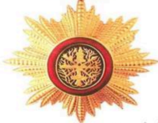
មេដាយព្រះរាជាណាចក្រកម្ពុជា ថ្នាក់ ជបឱន្ទ ផលិតនៅប្រទេសចារ៉ាំង