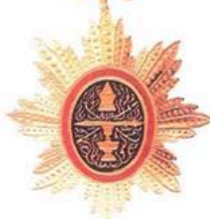
មេដាយព្រះរាជាណាចក្រកម្ពុជាថ្នាក់អស្ស័យដ្ឋិ Royal Order Of Cambodia Chevalier