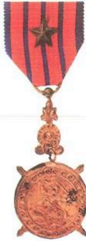
មេដាយការពារជាតិ សម័យសាធារណរដ្ឋខ្មែរ ផលិតនៅកម្ពុជា (១៩៧០_១៩៧៥)