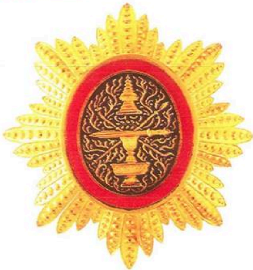
មេដាយព្រះរាជាណាចក្រកម្ពុជាថ្នាក់ មហាសេនា Royal Order Of Cambodia Grand Officer