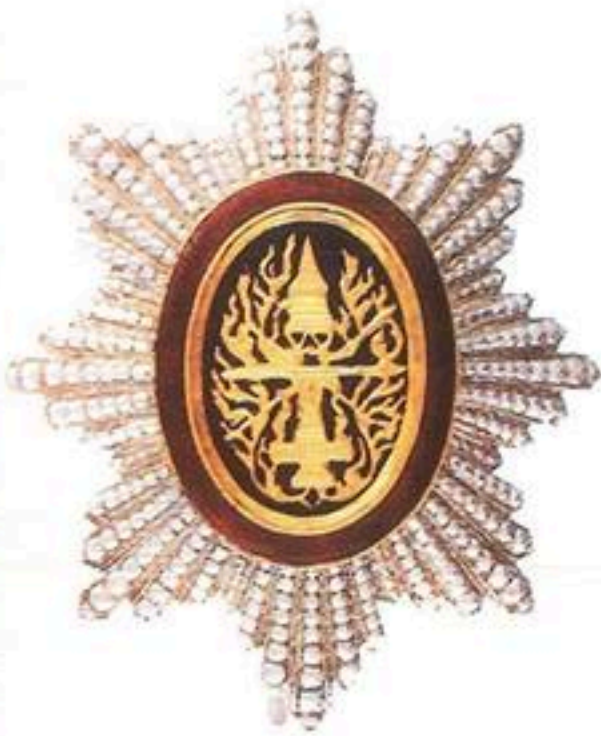
មេដាយព្រះរាជាណាចក្រកម្ពុជា ថ្នាក់ មហាសេរីវឌ្ឍន៍ ផលិតនៅប្រទេសចារ៉ាង