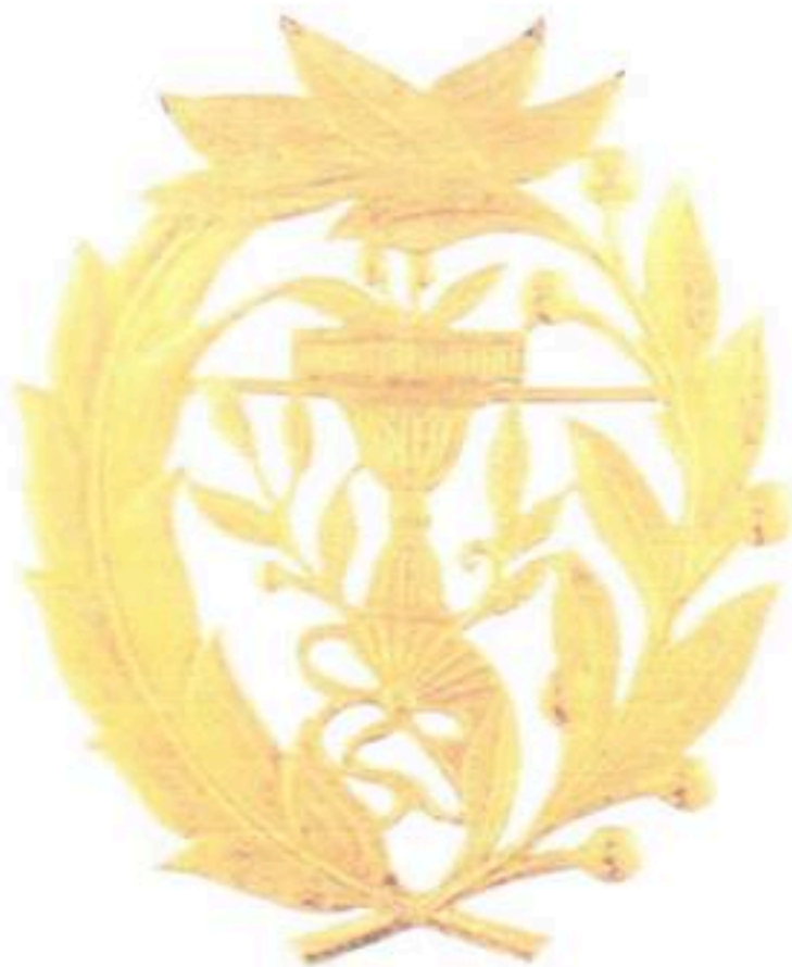
មេដាយមុនីសារាភ័ណ្ណាធាតុ មហាសេនា Royal Order Of Monisaraphon Grand Officer