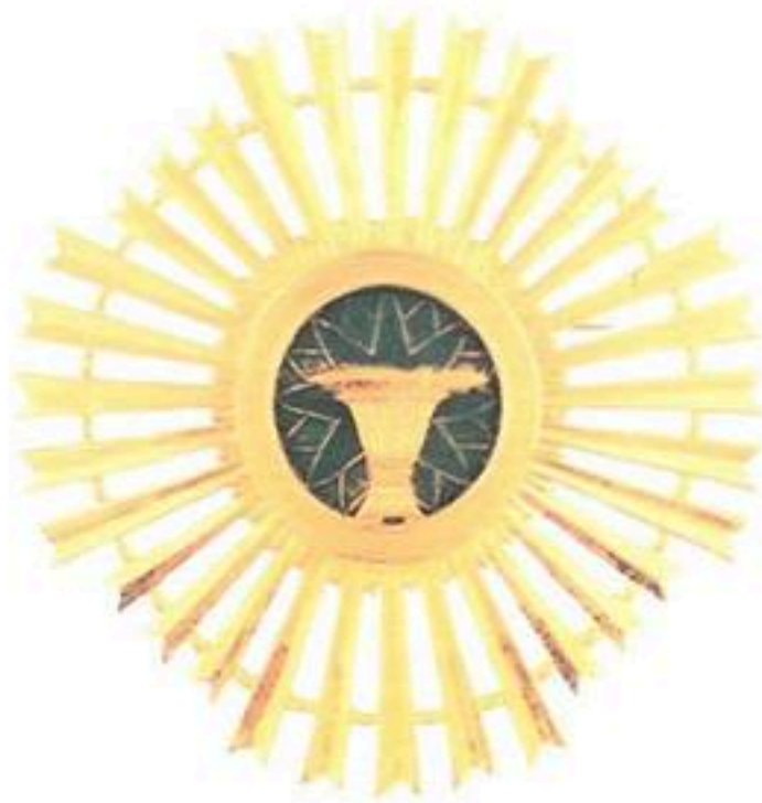
មេធាយសហមេត្រីផ្ចាត់ មហាសេនា Royal Order Of Sahametrei Grand Officer