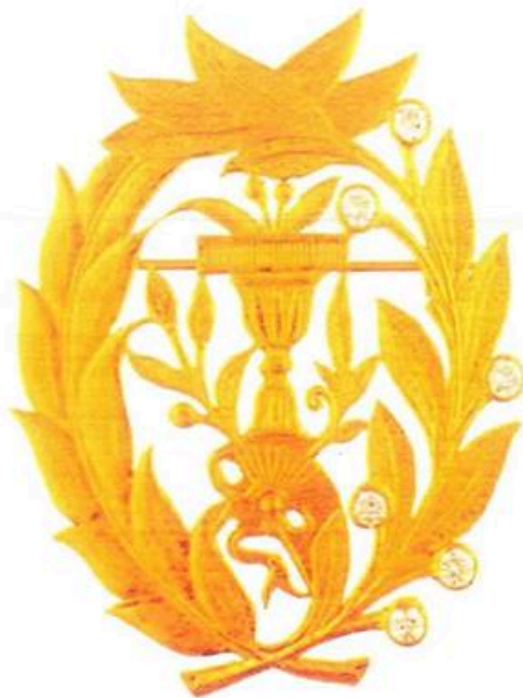
មេដាយមុនីសារាភ័ណ្ណដ្ឋាន់ មហាសេរីវឌ្ឍន៍ Royal Order Of Monisaraphon Grand Crose