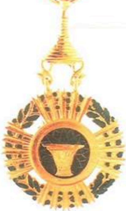
មេដាយ សហមេត្រីផ្នាក់ សេនា Royal Order Of Sahametrei Officer