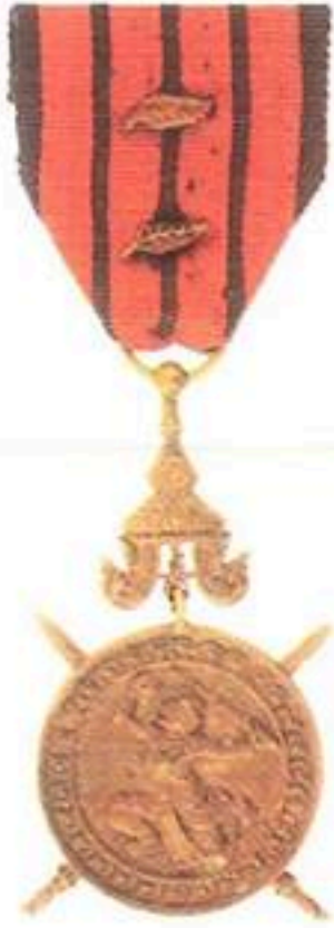
មេដាយការពារជាតិ ផលិតនៅប្រទេសចាវ៉ាង (១៩៤៨_១៩៧០)