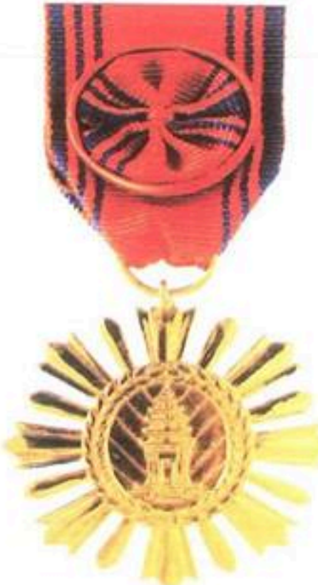
មេដាយឯករាជជាតិ National Independence Medal

តួសំគាល់មេដាយនេះធ្វើ អំពីលោហៈធាតុពណ៌មាស មានវិជ្ជ័យមាត្រប្រវែង ៥៥ ម.ម ។ ផ្នែកខាងមុខមានកម្រងផ្ការាងពងក្រពើមានសន្លឹកដើមឃីចៅនៅខាងក្នុង ដែលមានរូបវិមានឯករាជ្យ នៅលើមានកាំស្មីតូចធំចំនួន ១៦ កាំ ។ ផ្នែកខាងខ្នងនៃមេដាយមានភាពភ្លឺរលោង ។ វិមានឯករាជ្យដែលស្ថិត នៅចំផ្លូវខ្សែនៃមហាវិថី ព្រះនរោត្តម និងរុក្ខវិថី ព្រះសីហនុ ត្រូវបានស្ថាបនានៅឆ្នាំ ១៩៥៤ ដើម្បីរំលឹកដល់ថ្ងៃឯករាជជាតិ របស់ប្រទេសកម្ពុជាពីអាណានិគមបារាំងក្នុងឆ្នាំ ១៩៥៣ ។ វិមានឯករាជ្យនេះក៏សម្រាប់រំលឹកវិញ្ញាណក្ខន្ធរបស់អ្នកដែលបានពលិជីវិតក្នុងអំឡុងពេលសង្គ្រាមឆ្នងដែរ។តួមេដាយព្យួរពីខ្សែបុព្វហេតុហាមមានទទឹងប្រវែង ៣៧ ម.ម ដោយមានផ្ចិតពណ៌ខៀវក្រាស់ និងផ្ចិតពណ៌ខៀវស្លើង ២ អមនៅតែមសងខាង ហើយមានផ្កាកុលាបនៅចំកណ្តាល។