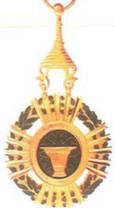
មេដាយ សហមេត្រីផ្នាក់ អស្ស័យទ្ធិ Royal Order Of Sahametrei Chevalier