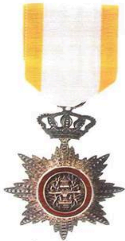
មេដាយព្រះរាជាណាចក្រកម្ពុជាថ្នាក់ អស្សុប្បន្និ ផលិតនៅប្រទេសចារ៉ាង