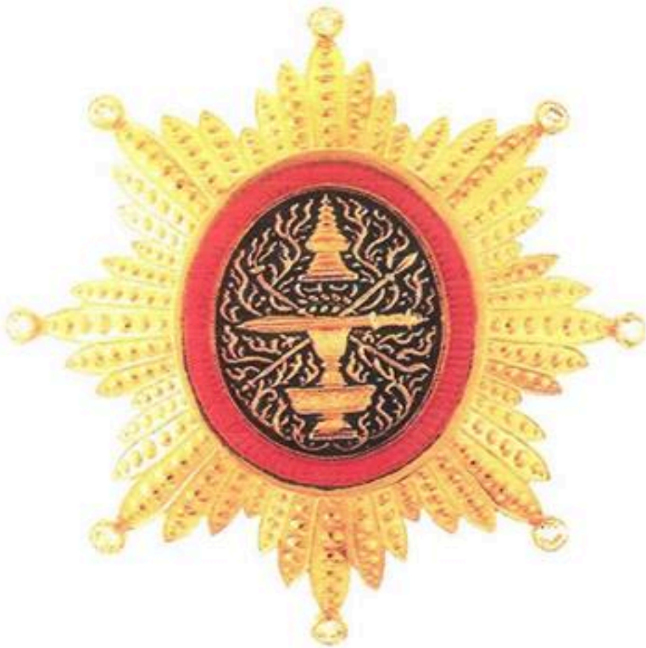
មេដាយព្រះរាជាណាចក្រកម្ពុជាថ្នាក់ សេរីឡុង Royal Order Of Cambodia Grand Cross