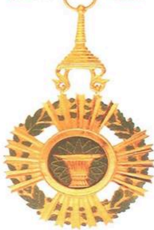
មេដាយ សហមេត្រីផ្នាក់ ជំបឺន្ត Royal Order Of Sahametrei Commander