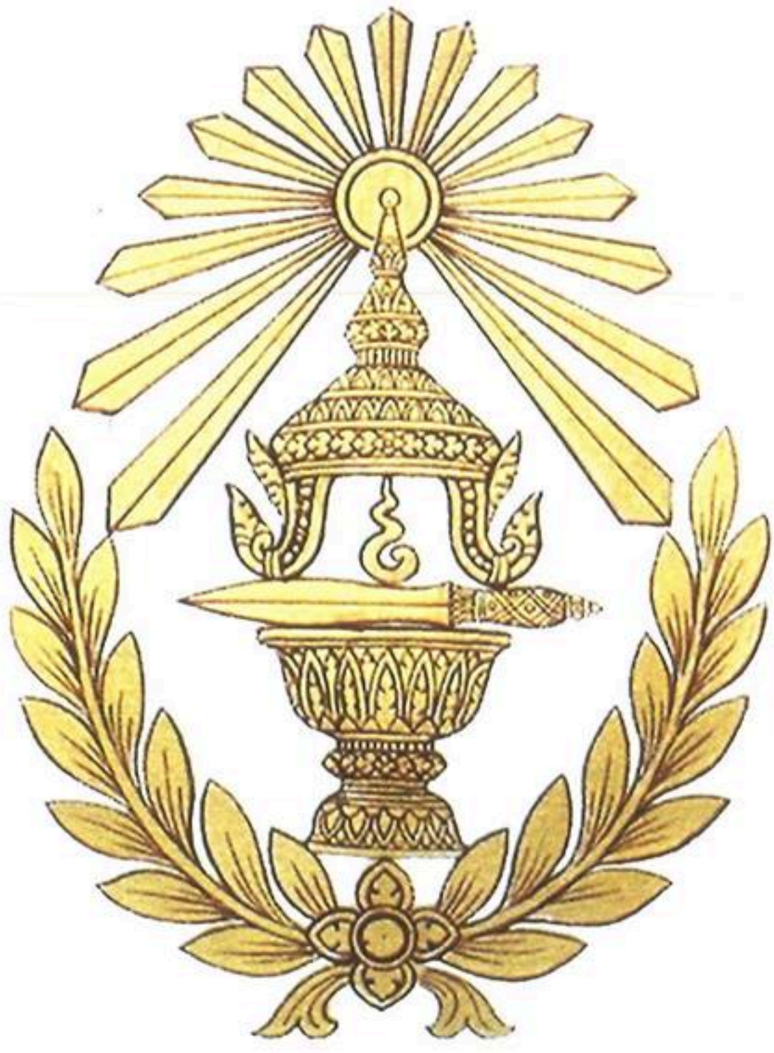
Coat Of Arms Of The Government Of The Kingdom Of Cambodia